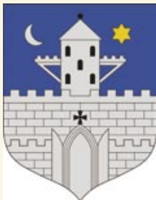
Szombathely M.J.V. Önkormányzata