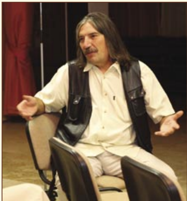
Az 50 éves évforduló tiszteletére Múltidéző délutánokat, estéket rendeztek a Bercsényi iskolában, ahol a kórus-tagok mesélték emlékeiket, 2009.

2006-ban az újonnan épült szőlősi templomban, majd a nárai templomban adtak koncertet húsvét előtt. Májusban a Savaria Múzeum előtt felújított Horváth Boldizsár szobor avató ünnepségén énekeltek. Júniusban Budakeszire látogattak az Erkel Ferenc Társaság meghívására. A Himnusz-szobornál közösen énekeltek a nemzeti imádságot és a Szózatot a budapesti és a gyulai Erkel Kórusral. Júliusban a zánati templomban adtak koncertet, majd Budai László vezetésével a kórus tagjaiból összeállt kamarakórus ismét elindult Erdélybe a Szentháromság Vegyeskar tagjaival kiegészülve. Amint a naplójukban írták: „visszahúzott már a szívünk Székelyföldre”, ahol régóta nem jártak. Nagyvárád, Kőrösfő, Györgyfalva, Kolzsvár, Torda, Marosvásárhely, Székelykeresztúr, Sepsiszentgyörgy, Kézdivásárhely, Gyergyószentmiklós, Madéfalva, Csíksomlyó, Székelyudvarhely, Farkaslaka, Korond,