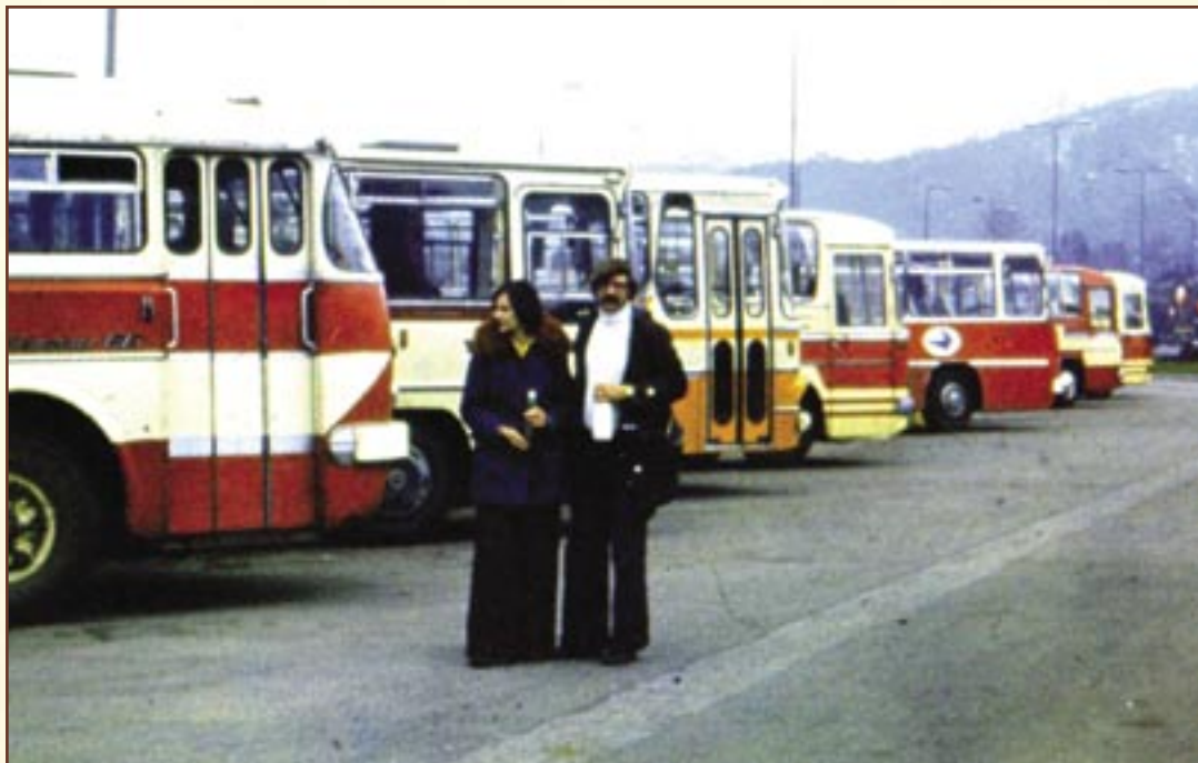
Zakopane, Lengyelország, 1977.

A kórus 1974-ben „Hangversenykórus” kategóriában