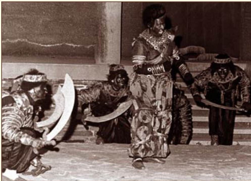
Varázsfuvola előadása az Iseumban, 1974. Jobbra: az Erkel kórus bulgáriai turnéján, 1973.

Az újságcikkeket képes albumokba gyűjtötték a kórustagok, melyeket lapozgatva találhatjuk meg Karai József, a neves zeneszerző bejegyzését, aki biztatásul azt írta nekik: „Daloljanak rendületlenül, sok sikerrel tovább, újabb évtizedekig!”