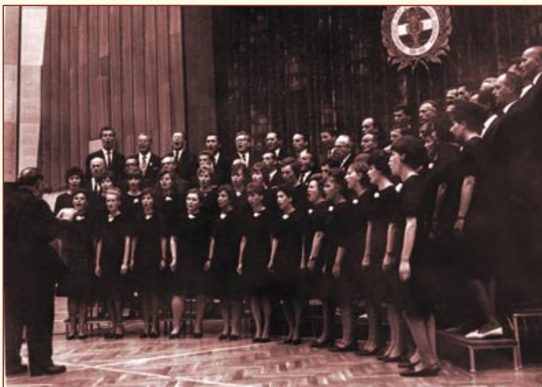
Iphigenia Taurisban - Iseum, 1967.