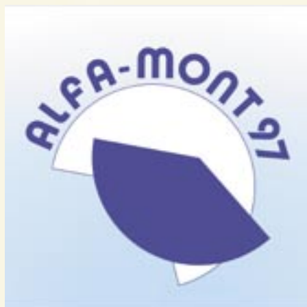
Alfa-Mont '97 Kft.

Bartók Béla Zeneiskola Czirfusz-Tóth Eü. Kft.