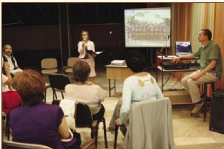
A négy Multidéző délután egyike a Bercsényi aulában, 2009.