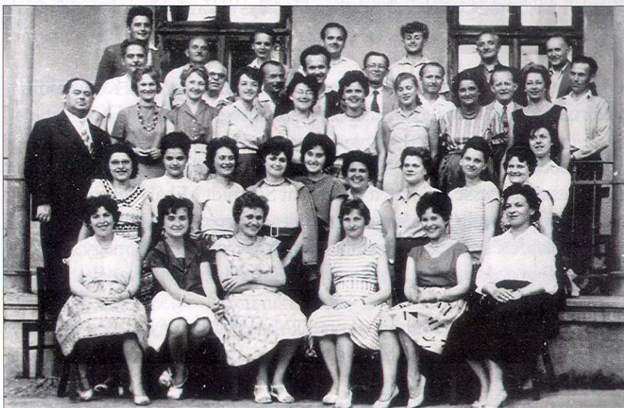
Próba után, 1962

Sikereik elismeréseként az együttest Vas Megye Tanácsa 1960-ban a megyei tanács kórusává nyilvánította, nevét pedig az Erkel-év emlékére Erkel Kórusra változtatta.