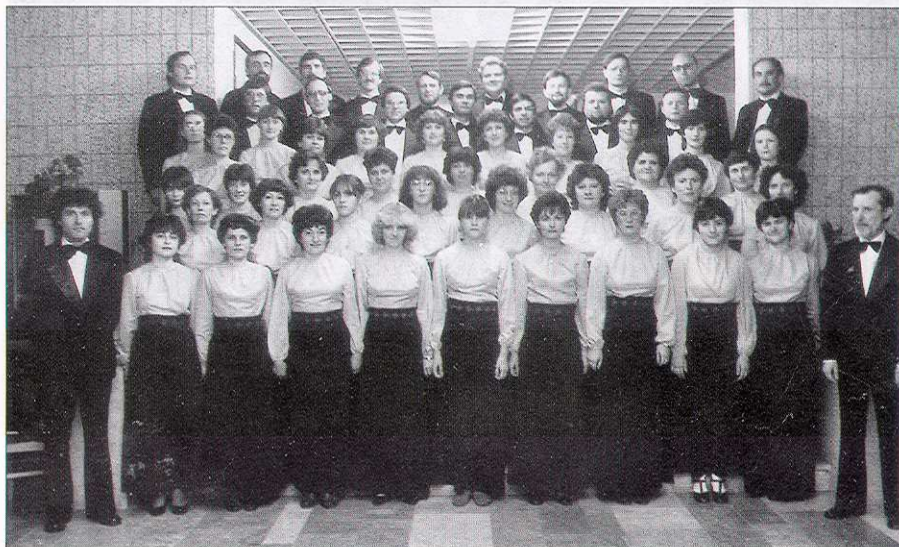
Farsangi bál - Bercsényi Miklós Általános Iskola, 1984

Márciusban ismét rádiófelvétel készült az együttesrel, majd vendégül látták a Solingen-Ohligs kórust, akik meghívását elfogadva 1984-ben a Német Szövetségi Köztársaságban járt az énekkar.