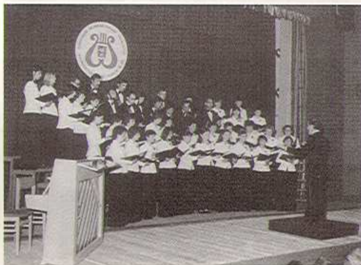
Országos Munkás-Dalos Találkozó, 1980

A következő évben ismét „Kiváló teljesítményért” plakettel jutalmazták a sikeres rádiófelvételért az együttest. Mégis – egy újabb válság időszak kezdetét jelezve – csökkenni kezdett a kórus létszáma.