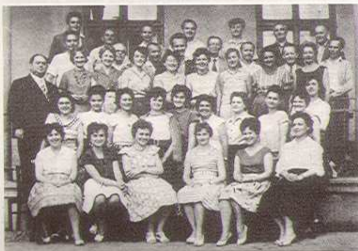
Próba után – a kórus „állandó munkásai”, 1962