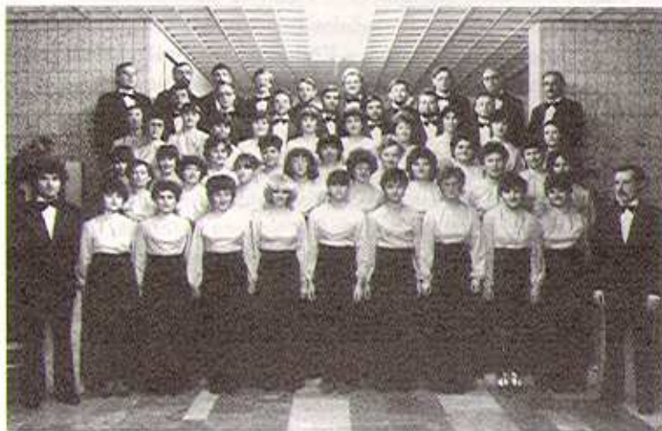
Farsangi bál – Bercsényi Miklós Általános Iskola, 1984

Márciusban ismét rádiófelvétel készült az együttesrel, majd vendégül látták a Solingen-Ohligs kórust, akik meghívását elfogadva 1984-ben a Német Szövetségi Köztársaságban járt az énekkar.