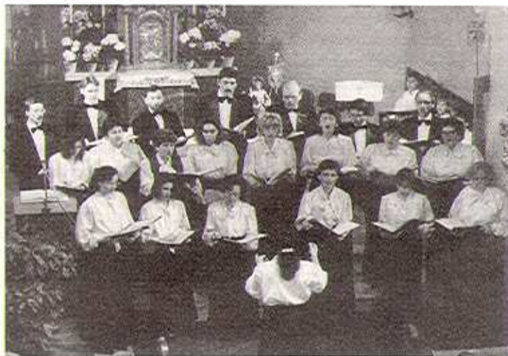
Templomi hangverseny – Kőszegszerdahely, 1992

Csendes műhelymunkát terveztek az 1992-es évre. Hogy mégis más-képpen alakult, jelzi, hogy a kórusra kezdett odafigyelni a közönség. Júniusban az Agrowest Kft. létrehozta az Erkel Kórusért Alapítványt, hogy segítse az énekkar munkáját.