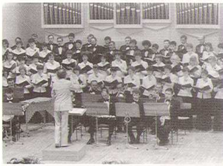
Eisler-művek magyarországi bemutatója, 1978

A sikeres rádiófelvételek jutalmaként 1976-ban megkapta a kórus a „Kiváló teljesítményért” plakettet, és szerepelhetett a Kóruspódium nyilvános záróhangversenyén. De nem ért véget a sikersorozat: decemberben az újabb minősítő hangversenyen az énekkar – két kategóriát előrelépve – megkapta a legmagasabb, „Fesztiválkórus” fokozatot.